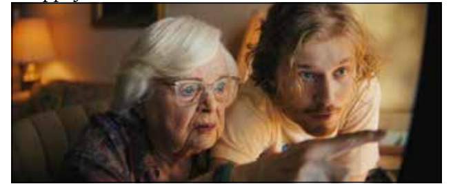
Risto Räppääjä ja kaksoisolento sekä Thelma.