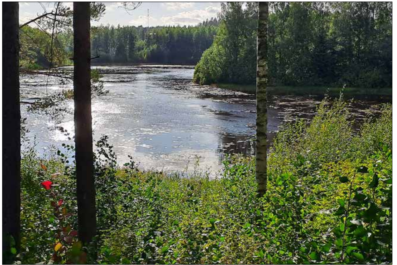
Palokan luonto koetaan yhdeksi tärkeimmistä alueen vahvuuksista

Suunnittelijat ovat hyvin koulutettuja ja rakennusfirmat osaavat epäilemättä toteuttaa projekteja. Palokan suunnitteluun toivomme rohkeutta ja näkemyksellisyyttä vallitsevasta virras- ta poikkeavan asumisen