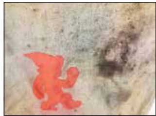
Myös kulkijoiden iloksi laitettua pukkia on yritetty polttaa.