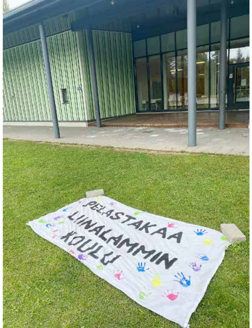
Liinalammin koulu sekä kodin ja koulun päivään syyskuun alussa lasten tekemä lakana.

Järjestimme marssin, joka oli taistelutoimenpide myös vuonna 2008, kun Liinalammin koulu oli edellisen kerran aie sulkea. Silloin vanhan tilalle rakennettiin tämä nykyinen koulu. Kun marssi ei tällä kertaa vielä purrut, lapset olivat yhden koulupäivän lakossa.