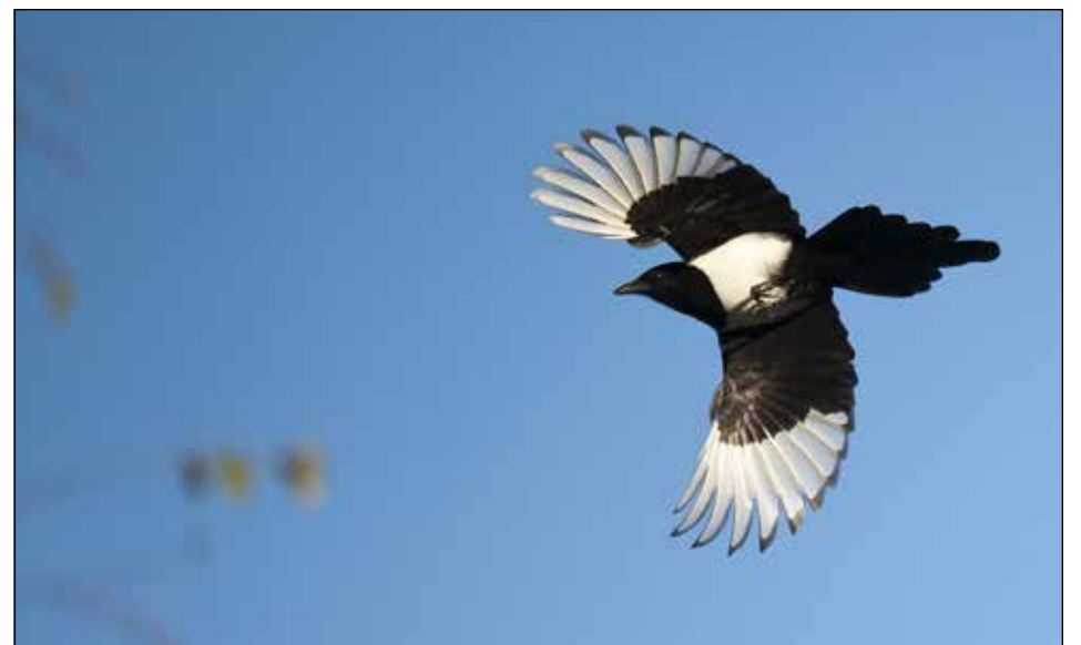
Harakka on tuttu pihapiirin lintulaidoilla käyvä laji. Se on yllättävän arka, mutta viisas lintu. Jos jätät jonkun ruokapalan pihalle ja vaikka harakkaa ei näy, niin pian se on napannut herkun ja lentänyt pois. Koettu on!