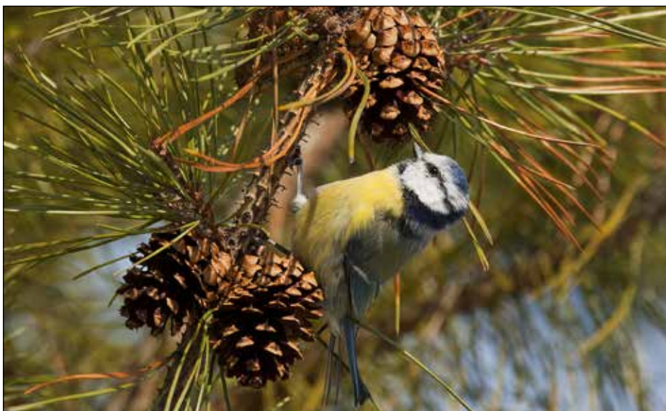
Valtakunnallisessa pihabongauksessa tavattiin yli 100 lintulajia. Talitiainen oli yleisin laji ja kuvan sinitiaainen toiseksi yleisin. Sinitiaisia tavattiin lähes 13 000 pihalla 57849 yksilöä.