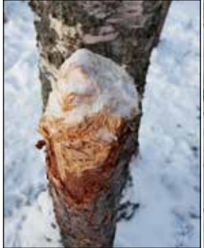
Useita puita on katkottu, ilmeisesti kirvellä.

asemakaava-alueella on aina luvanvaraista toimintaa.